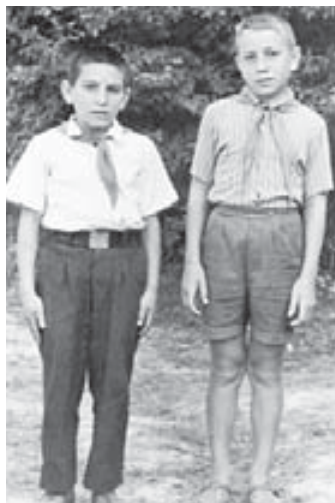
С товарищем в пионерском лагере