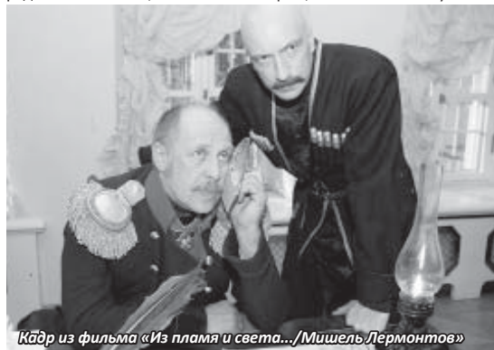
Кадр из фильма «Из пламя и света.../Мишель Лермонтов»

ны в любви, уважении друг к другу – это невероятно важно. В нас, родившихся на Кавказе и живущих сегодня в Центральной России, до сих пор есть это солнце, которого очень много на родине. И потом, жить в столице, осознавая, что у тебя есть корни, родные, настоящий дом, куда все время возвращаешься, – это богатство. Это такой праздник, который всегда с тобой.