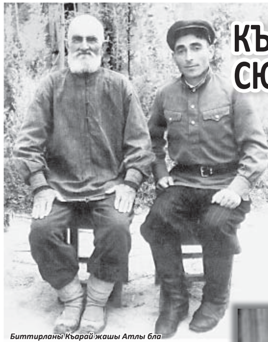
Биттирланы Къарай жашы Атлы бла

Биттирланы Шабатайны жашлары Къарай бла Алий Акъ-Сууда бир арбазда ата юйлеринде жашагьандыла. Къарай тамата эди. Аталыкь-аналыкь да эте эди гитче кьарындашына. Ол да, кеси жанындан таматасына хурмет эттенди. Эл сукьылана эди аланы араларында халгьа. Эгиз сабийлеча бир бирлеринден айырылмай, ише жетселе уа-бири биринден алгьаракь барып, ауурлугьун кеси кетюрюрге, женгилин а кьарындашына кьояргьа кюреше эдиле. Къарындаш соймеклик кертиси бла да былай бола кереме да деп, адамла алагьа сукьлангандыла.