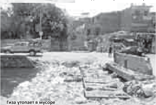
Гиза утопает в мусоре

Красное море – прекрасное море. В Шарм-эль-Шейхе мой пятизвездочный отель (мой – на одиннадцать ночей) располагался прямо на берегу моря. Заход – песчаный. Но только заход, далее – скользкие камни, требующие специальной обуви. Но даже для меня – единственного человека на пляже, не умеющего плавать – у Красного моря были сюрпризы. Буквально на берегу плавали разноцветные рыбы, целые стаи. Только заходясь в море, они думают, что очередной доброй души человек хочет