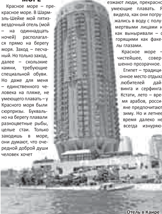
Отель в Каире