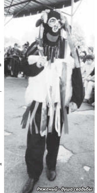
Ряженный – душа свадьбы

мало кого прельщает. Но если это праздник твоего народа, куда пришли и стар, и млад, мало кто останется в стороне. И в этот день все ринутся в бой, забыв про компьютеры, айфоны и планшеты. И как встарь, на том же поле за селом, в честной борьбе победят сильнейшие.