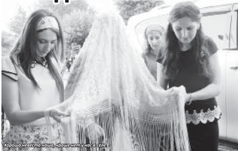
Хороша невеста наша, краше нет у нас в селе

Также фонд возродил «Нартские игры». В век компьютерных игр конные забеги, борьба стали уделом профессионалов, а лезть на шест с подарками или перетягивать канат тоже