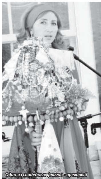
Один из свадебных флагов – ореховый

...Итак, в Ташлы-Тале гуляли свадьбы. Безалкогольную, как в традиции? Увы, увы и ах... Свадьба в сознании многих ассоциируется с «пьянкой», но встарь пили бозу – наци-