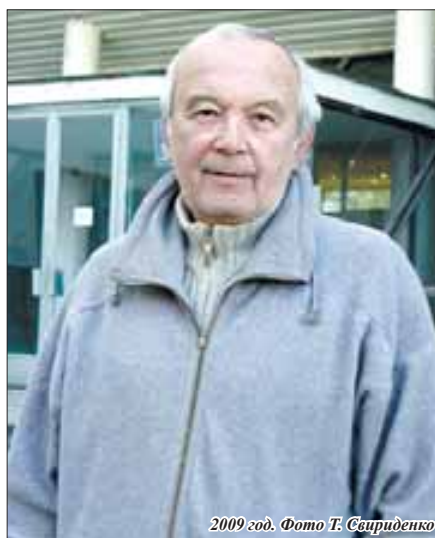
2009 год.

В Нальчик Марк Расторгуев впервые попал в 1972 году – приехал навещать родственников – и был поражен очарован городом: «Сочетание голубого неба, белых вершин и зелени