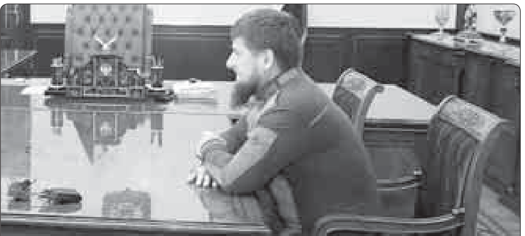
Лэжыгъэ луэхуклэ КЪБР-м и Правительствэм и Унэм щызэхуэзэри элпсэлъаш Къэбэрдей-Балъкъэр Республикэм и Итэщхьэ Клуэклуэ Юрийрэ Шэщэн Республикэм и Итэщхьэ Кадыров Рамзанрэ. АБЫХЭМ къыхагъэщцэхуэлаш зэгъуэ-нэгъуэ щыналъытым яку зэкъуэщыгъэрэ зэгурьуэныгъэрэ зырдэлъыр, ахэр экономикэм, егъэджэныгъэм, медицинэм, спортым, щанжэбэм я Итэнтэхэм зырыщцэдэлэжэ нэхэри зегъэуэжыны зырыщцэу. Апхуэдэу зэлущэм шытепсэлъы-хыщ шынагуэуэныгъэ къызыгъэпэщыным, экстремизмрэ терроризмрэ ялэщцэ-ным пыщла луэхуэр. Клуэклуэ Юрий хьэщцэм ехуэахуэащ 2016 гъэм фокладэм и 18-м еклукла хьэныгъэм ар нэрлыгъэууэ зырыщцэуахуэмкэ икли