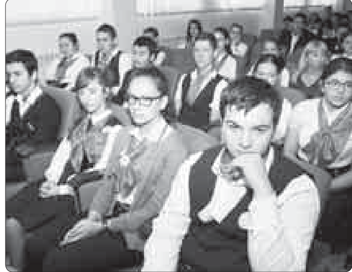
● Жыжьэ - гъунэгъу