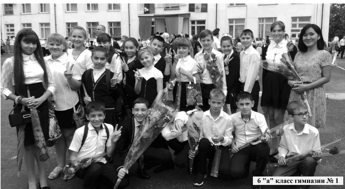
6 "а" класс гимназии № 1

Учебный год – это нелегкая работа по воспитанию и обучению детей, требующая от педагогов огромного терпения, внимания и доброты. Ведь только учитель, относящийся к работе с душой и вдохновением, способен зажечь в учениках стремление к учебе, развить умение думать, чувствовать, сопереживать и анализировать.