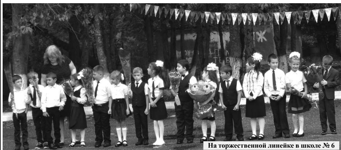
На торжественной линейке в школе № 6