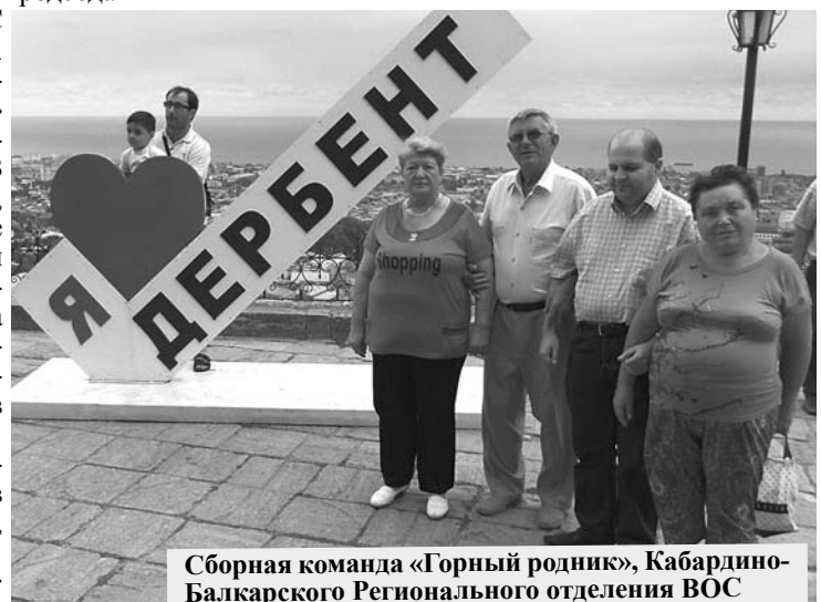
Сборная команда «Горный родник», Кабардино-Балкарского Регионального отделения ВОС

Северо-Кавказский кубок «КИСИ» проводится с 2015 г.