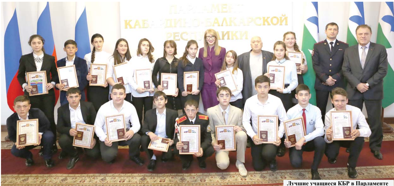
Лучшие учащиеся КБР в Парламенте