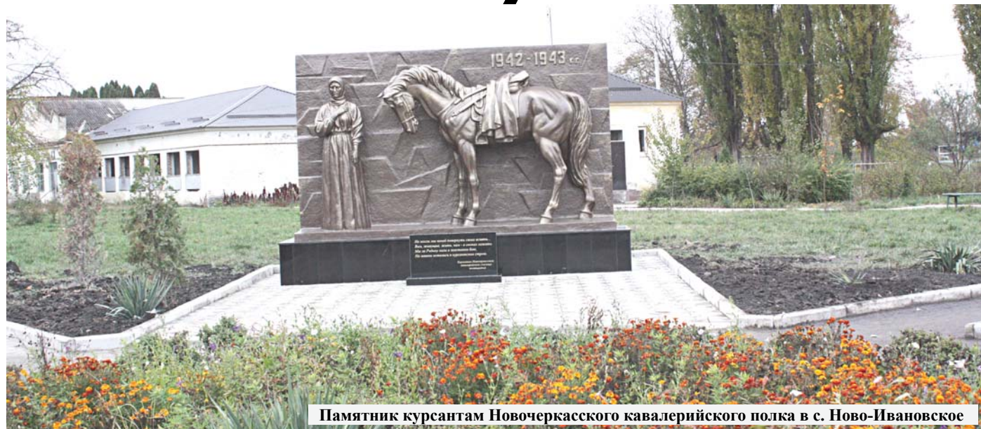
Памятник курсантам Новочеркасского кавалерийского полка в с. Ново-Ивановское

Не могли мы коней повернуть своих вспять.. Вам, живущие, жить, нам - в окопах лежать.