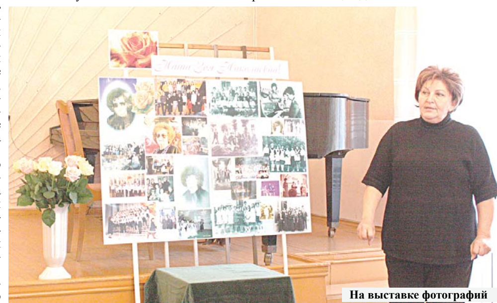
На выставке фотографий