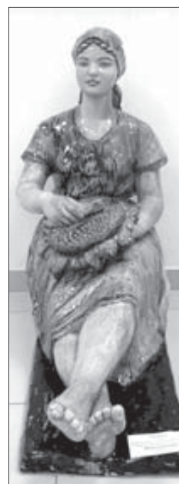
Левицкая Г. П. «Девушка с подсолнухом». Майолика, 1959