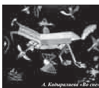
А. Кадыралиева «Во сне»