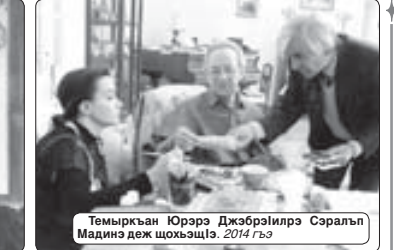
Темыргъан Юрэрэ Джэбрэйлрэ Сэралп Мадинар деж шохьэщэ, 2014 гъэ.

СОВЕТХЭМ я тегъуэу цыфхуэ дежкэ къыгъэщэр абы щытэр шыпхьхуэ, Ар зымлым и лухур йонхуи, Цыфхуэ зилэ цыфхуэ шцхьэныгъэном епшалэ хуныкхуи. Цыфхуэныгъэу? А дикхэер зэщалтгъуэщ.