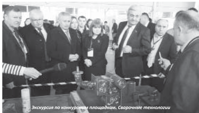
Экскурсия по конкурсным площадкам. Сварочные технологии

(Репортаж с площадок чемпионата читайте в ближайшем номере)