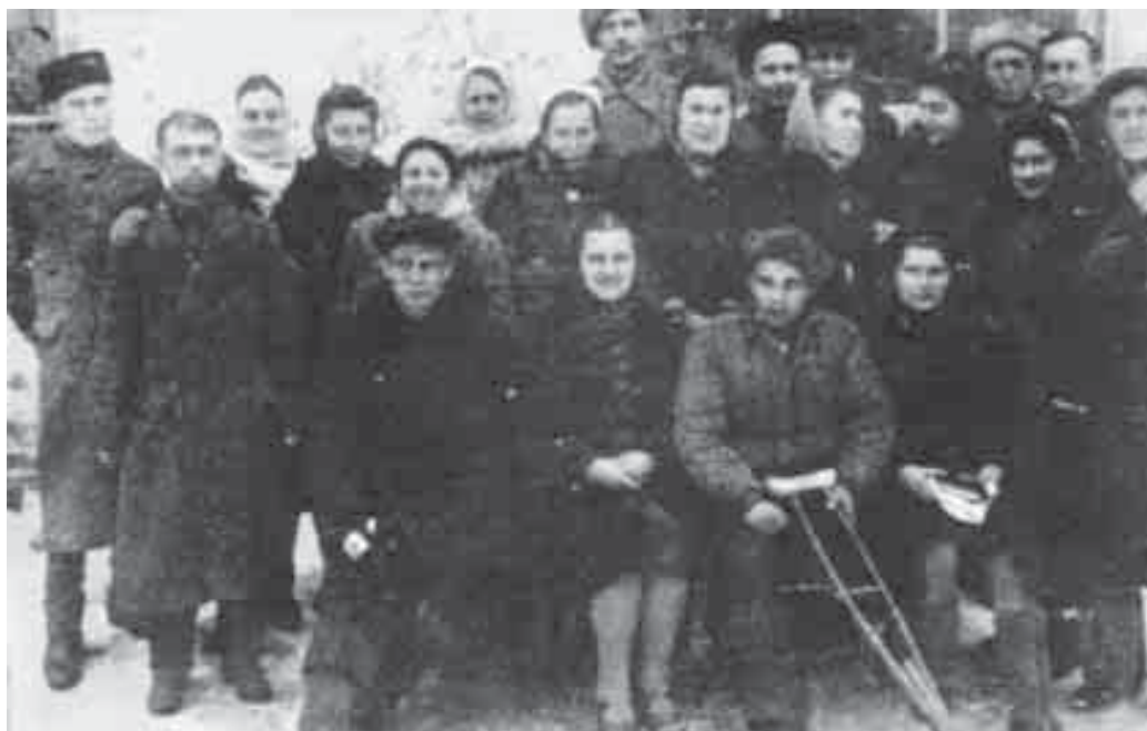
Радиокомитетым и лэжъакIуэ гуп. 1945

Хэку зауэшхуэм ТекIуэныгъэр совет цIыхубэм кыщи-хын папцIэ радиом сэбэпынагъыу иIар к'алгытэри, майм и 7-р, Урысейм япэу щыщыпсэлгъа махуэр, Совет радиом и махуэшхуэу ягъэуващ. Къэбэрдей-Балък'гэр радиори мафIаем кыыхэкIащ нэхъри лыпIэ иувауэ икIи ефIакIуэу щидзэжащ. 1945 гъэр щихым республикэм ис унагъуэ минипцIым радио щылажъэрт, цIыхухэм приемник 200 яIэт.