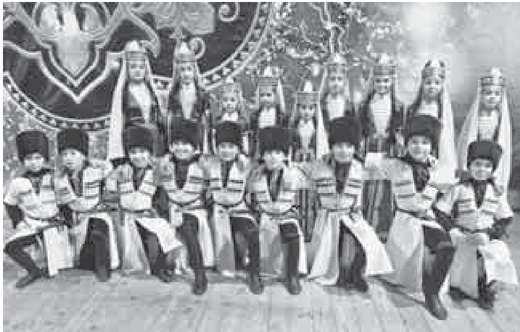
«Дыгъэ шыр» ансамблым хэтхэр. 2016

«Дыгъэ шырым» «солист»-кIэ зэджэ къэфаклуэ пажэ иIэктым, абы и щхьэусыгъуэри я гъэсаклуэм гъэщIэгъуэну къеуатэ: «Къафэм и зы пкъыгъуэр зы сабийм нэхъыфлу къохьулэ, адрейм — нэгъуэщI пкъыгъуэр нэхъ еклуу егъэзащIэ. Абы кыыхэкIкIэ, щхьэж и зэфIэкIхэр къэслъытэурэ, я увьпIэри, ягъээщIэну теплъэгъуэхэри субзыхуа нэужь, къафэр зэрыщыту зэхызогъэувэ. Солист щIыхэзмыхым и зы щхьэусыгъуэщ сабийм и жагъуэ сщIыну сызэрыхуэмейр. Сэ сызэреплтымкIэ, сабий щыбгъасэкIэ, и Iэпкълъэпкъым зегъэужьыным — къафэм хуэгъэпсыным къыдэклуэуи, и псэм и щытыкIэри Iуэхум кыыхэлъытэн хуейщ, абы хуэсакъыпхьэщ».