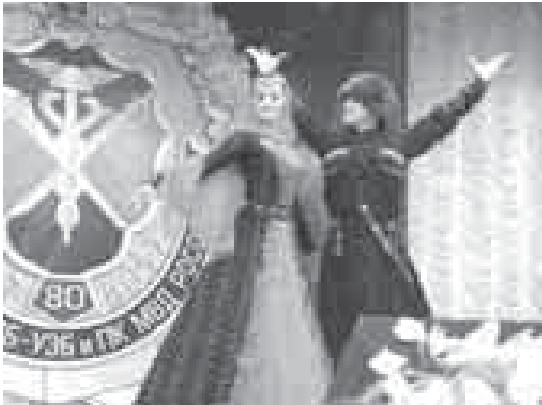
«Балкария» ансамбльни солистлери тепсейдиле.

ХОЛАЛАНЫ Марзият.