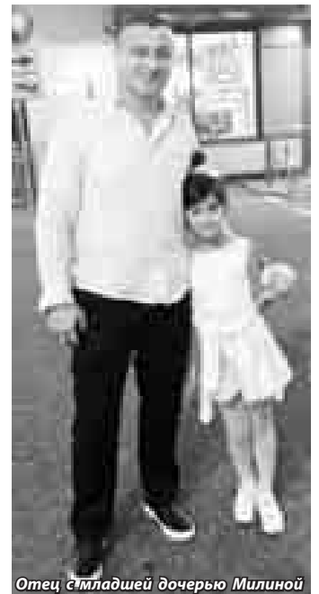
Отец с младшей дочерью Милиной

- Так может рассуждать только верующий человек.