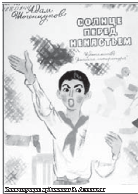
Иллюстрация художника Э. Асташева

Первые повесть была издана в 1964 году в Нальчике в издательстве «Эльбрус» и проиллюстрирована графиком И. АБРАМОВЫМ. Рисунки основаны на фабульно-