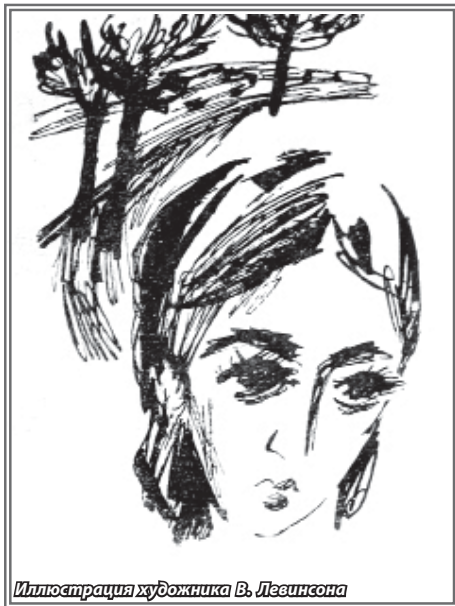
Иллюстрация художника В. Левинсона

Одним из первых серию рисунков к повести «Назову твоим именем» выполнил столичный график Б. МЕСРОПЯН (М., 1970, издательство «Советский писатель»). Художник пересказывает фабулу произведения образительными