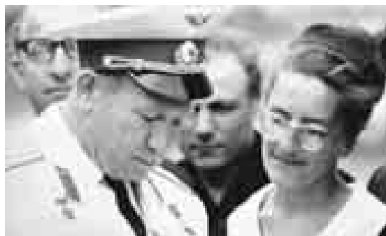
Космонавт А. Леонов дает автограф: «Комсомолу Тырныауза быть на такой высоте в работе, на какой живете»