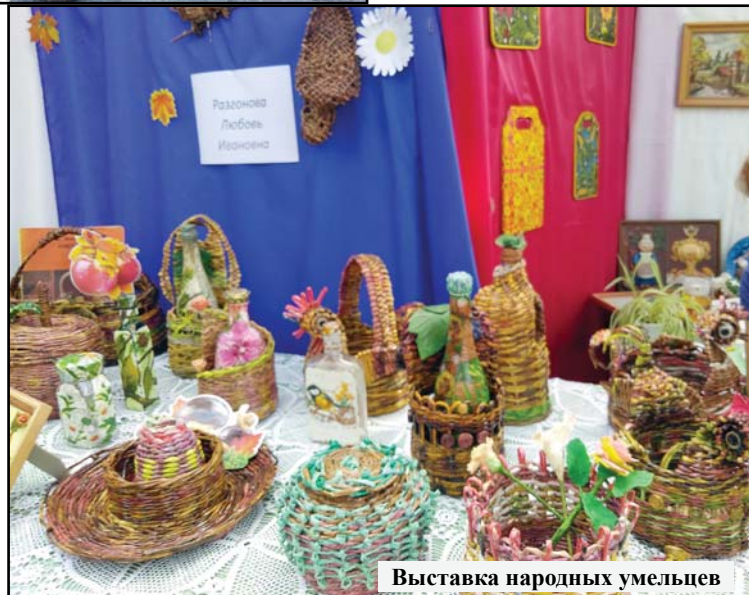
Выставка народных умельцев

С интересом были восприняты фотовыставки, посвященные истории станицы. Особенно привлек внимание стенд под названием «Станичники».