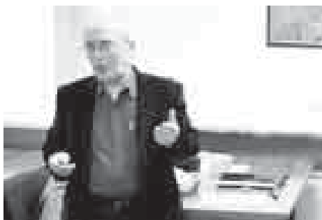
дан, транспорт эмда инженер инфраструктура, солуу тийре, жумушла бла жалчытуучу объектеле да кьураллыкдыла. Бизни корр.

эм башхала кьатышхандыла, деп айтылады администрацияны интернет-сайтында. Айтылган жер 39 гектарны тутады. Анда дачала кьуаргъа оноу этилгени себепли тийрени планировкасыны проектин жарашдырырга, ол санда жер юлюшлени чеклерин да белгилергекерекди. Битеу да анда 349 участка кьуралганды - хар бири 6,5-9 сотка. Жыйылыуда кьргюзюлген проектге кере анда дагыда спорт май-