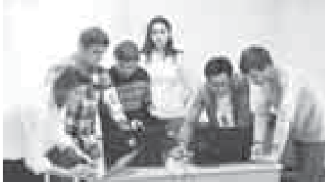
рылган форумда бизни проектлерибизге жетген болмаганды. беплик этген программаны кьураганы ючюн «Skat» кьауум чыкьганды. Аны