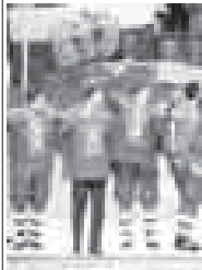
ТИКАЛАНЫ ФАТИМА хазыргъанды.

Кореяда 14 алтын, 14 кюмошу, 11 доммакъ майдал къытхандыла. Алай бла 39 майдал къылуу болуп, норвегиялы жаны рекорд тохташдырыгъандыла. Алагъа дере уа майдалланы санына кьере алчылыккыны АБШ-ны командасы тутханды - 2010 жылда 37 майдал алып.