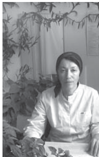
Олтурган Гузойланы Зукуралы

жореге жарылганыдан эди. Зукура аяа тийишли багыну этип тебейрди. Кычтанды да бир медестраны кюды. Кеси уа башха саусуларына бакъты болады. Кече белгине ауур саусуну кычтандыгы саусузга, аяа кетип, бетти да тыгырдан акъ болуп бир сей-