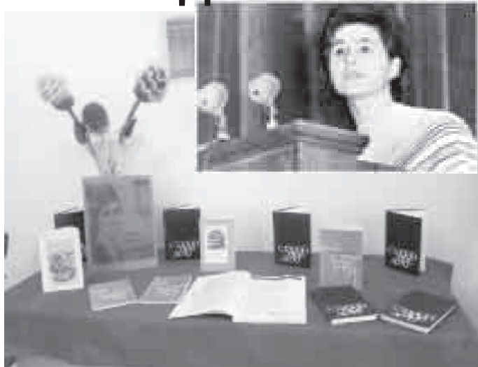
ПОЭТИЧЕСКИЕ ВЕЧЕРА, ПОСВЯЩЕННЫЕ 75-летию СО ДНЯ РОЖДЕНИЯ СОВЕТСКОЙ ПОЭТЕССЫ И ПЕРЕВОДЧИКА ИННЫ КАШЕЖЕВОЙ, ПРОШЛИ ВО МНОГИХ УЧРЕЖДЕНИЯХ КУЛЬТУРЫ И ОБРАЗОВАНИЯ РЕСПУБЛИКИ.

В фойе библиотеки была оформлена книжная выставка, где каждый желающий мог поближе познакомиться с биографией и произведениями Инны Кашежевой.