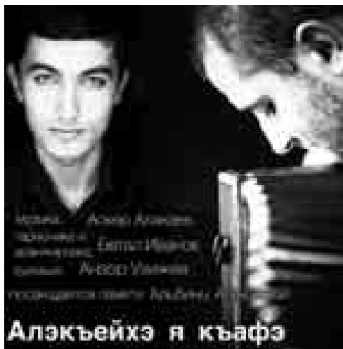
Алэкъейхэ я къафэ

рательно относилась к музыке, мне было важно ее мнение. Ей понравилось, чему я был очень рад. Но времени на профессиональную запись мелодии не было.