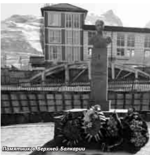
Памятник в Верхней Балкарии

В Эльбурском районе также проводится большая работа по увековечению памяти воинов. Военные события августа - декабря 1942 года в Приэльбрусье