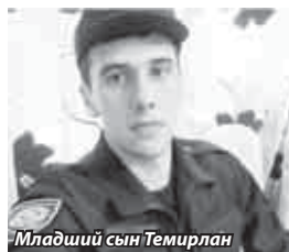
Младший сын Темирлан

приятной работой – погрузкой двадцати гробов с телами погибших солдат в самолет, как его называли, «Черный тюльпан», вывозивший их в Советский Союз. Именно тогда я дал себе слово, что домой вернусь живым, а не на таком самолете. Это не значит, что я прятался за спины других. Война не прощает малодушия. Просто сознание отчетливо усвоило, что надо воевать, как учили, и четко ис-