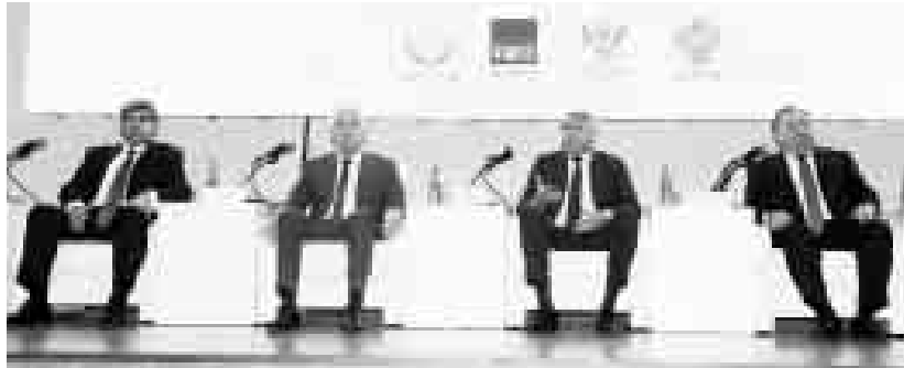
Форум «Медиавстреча на Северном Кавказе», прошедший 5-6 декабря в Махачкале, в котором приняли участие полномочный представитель Президента России в СКФО Александр МАТОВНИКОВ, главы субъектов и 150 журналистов региональных и федеральных СМИ, стал одним из самых значительных событий в медиасфере за этот год. Организаторы – Правительство Дагестана и информационное агентство России «ТАСС» при поддержке аппарата полномочного представителя Президента РФ в СКФО и Министерства РФ по делам Северного Кавказа.