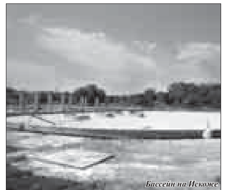
Бассейн на Искоже