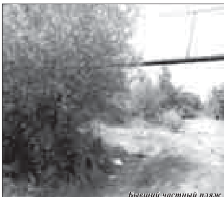
Бывший частный пляж

Сегодня, кроме разрешенного Курортного и речки без гарантии безопасности, мест для купания в городе практически не осталось, если не брать в расчет бассейны в частных домах. Бассейнами также располагают некоторые санатории, но это совсем другая история – и другие расходы.