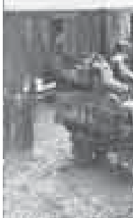
ил 15-20 марта бошаргъа боллукъды, агъагда терекле чакъынычы...».

Бзы бла малкър халкыны кѣчюроурге документле хазырландыла. Аланы окуп, Паврентий Берия Сталиннге таулуланы аманлап, справкка жарашдырады. Анда уа халкда бандитле, гитлерчилеге болушандыла бардыла деп жазады, телеграммасын а былай сезле бла бошайды: «Чеченилини бла ингушуланы депортациясы бошланганды, эркин аскерчилени бла чекиствени таулуланы Шимал Кавказдан кѣчюроуде хазырлангъан, операцияны бый-