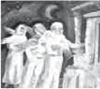
«Ауушхан тишируулары жанлары тууган элдерине кьайтадыла». Занкишиланы Ибрагим.