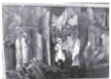
«Ашыруу». ТьЕпеланы Хьызыр.