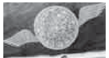
«Юйге». Голюйланы Шамил.