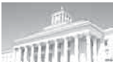
де жангы жашуа къурайды. Аны бла бизге не улуу къыйынлыклары да биз жалаңда биригип хоралыялгыбызны, тууган Къабарты-Малкърга бызын къолайлы келир заманы жалаңда бирге жалчатылгыбызны шорт кѣргюзтеди.

Бююлюкде республиканы халкларыны шухѣ юйюрюн-