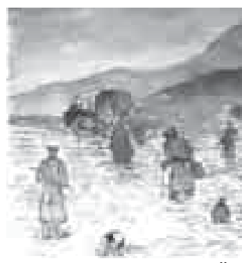
«Март 1944». Сарбашланы Азур.

Ол сюрюнню юсюнден салгьан суратла бир нечча боладыла. Аланы араларында «Елюмно жолу бла», «Урушдан – киши жерине», «Триптих» кеслерине энци эс бурдыла. Барадыла белгисизликни Барадыла белгисизликни кьоркьуулу жолу бла таулу кьартла, сабийле, тишируула, тегереклеринде уа – сауутланган совет солдатла. Елюме элтегенча, сур, белгисизлик жолу.