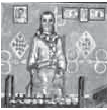
«1944 жылны алмалары». Курданланы Валерий.