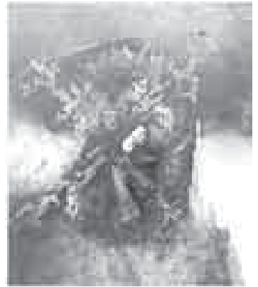
«Сыйрат кепюр». ТьЕпеланы Хьызыр.

ГОЛЮЙЛАНЫ Мажитни жашы Шамил бусагьада да Кьазахстанда жашады.