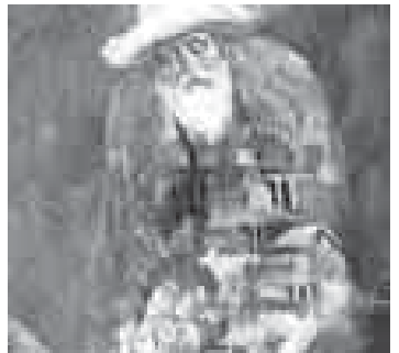
«Кьадар». ТьЕпеланы Хьызыр.