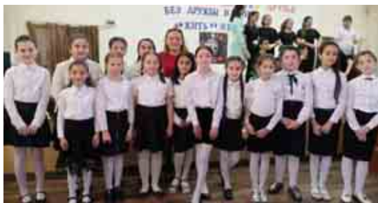
Под лозунгом «Возьмемся за руки, друзья. Без дружбы в мире жить нельзя» в актовом зале МКОУ «СОШ № 5» г. Нальчика прошло торжественное мероприятие, посвященное дружбе.

В нем приняли участие члены школьного клуба юных читателей, созданного осенью прошлого года, а также ученики 3-х, 4-х, 6-х, 7-х классов. В рамках мероприятия прозвучали песни и стихи, посвященные примерам