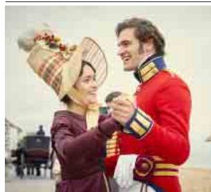
(Окончание. Начало в № 14) «УБИЙСТВО» (2009)

Первый сезон скандинавского сериала увлекает так сильно, что 20 серий не кажутся чем-то долгим. Более того, он не оставляет и после просмотра, постоянно всплывая в сознании.