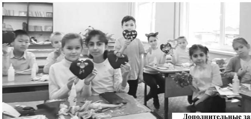
Дополнительные занятия в гимназии № 1

Федеральный закон «Об образовании в Российской Федерации» и Концепция развития дополнительного образования детей ориентируют образовательные организации на эффективное использование возможностей сетевого взаимодействия.