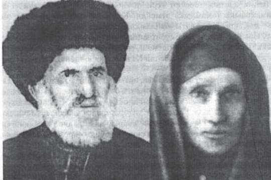
Кязим юй бийчеси Къанитат бла.

Усталыгъы халкъгъа жарагъан атанг хар заманда башына эркин болуп турмагъанын билесе.