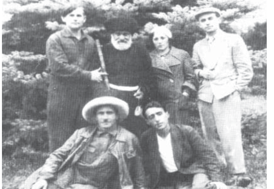
Жазуучуланы къаууму бла.