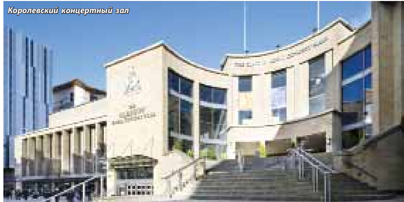
Королевский концертный зал