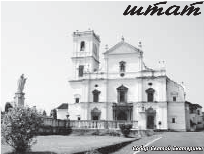
Собор Святой Екатерины