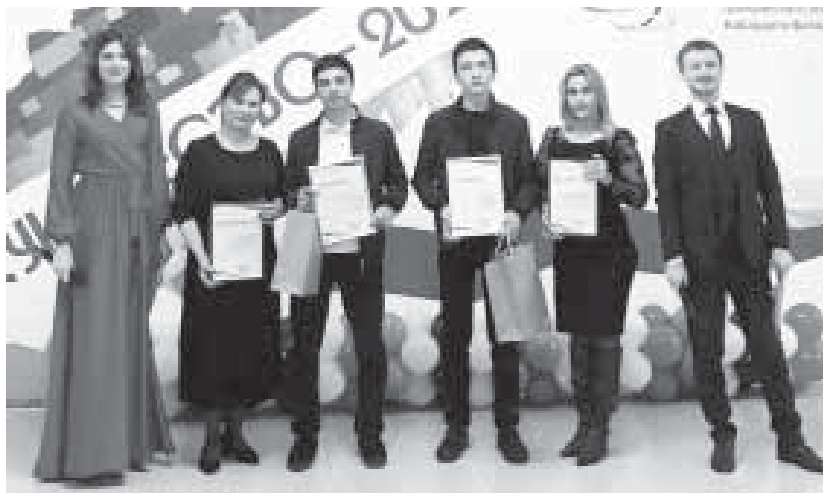
В Нальчике состоялась церемония закрытия республиканского проекта «Куначество-2021», реализуемого Министерством по взаимодействию с институтами гражданского общества и делам национальностей КБР.

По итогам проекта в торжественной обстановке участникам были вручены сертификаты и ценные подарки, а также благодарственные письма их