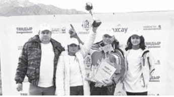
Владикавказны сатыу-алуу экономика техникуму устанлары, аш этюу, кидиртер эм гыркын биширну жаны бла миллет эм халкыла аралы эришудеде хорлаганла билдиргенди. Ала бегирек да бизни командабызны азыклар жаратхандыла, алай бла кубок республикага къелтирилгенди.