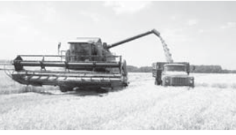
када нартохден саулай 872 миң тонна неда бурунгу жылдан 10,8 процентте кеп жыйылганды. Башча битимлене юсюнден айтханда, жыл жетишимли

Къырал статистика службаны Шимал-Кавказ федерал округда бөлүмюнден билдиргенерича, бытыр Къабарты-Малкъарнын аграрчылары 1,2 миң тонна мизреу жыйгандыла, ол а, бурунгу жыл бла тенгешдиргенде, 9,1 процентте къады. Алай бла аралы жылда хар гектардан 53,1 центнер тирлик чыкканды неда бурунгу жылдан 4,7 процентте аспам.