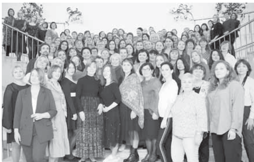
Финал всероссийского конкурса «Семья и будущее России-2022» проходит традиционно в конце октября. В этом году после ковидных онлайн-финалов он снова вернулся в обычное русло: 160 финалистов были приглашены на трехдневную практическую конференцию в Москву, которая прошла с 26 по 29 октября.

Конференция включала несколько общих «круглых столов», где участники могли обсудить много практических вопросов своей деятельности. В основном поднимались актуальные вопросы, возникающие в ходе работы журналиста «в поле». На «круглом столе» «Современные практики журналистской деятельности, направленной на решение социальных проблем» (ведущие - А. Гатилин, Л. КЕЙБОЛ), в основном разговор шел о проектной работе журналистов, начиная с определения проблемы, которые необходимо решить, постановки цели и задачи и разработки мероприятий. В ходе «круглого стола» был проведен мастер-класс, где каждый участник мог разработать свой проект и получить советы опытного специалиста по его реализации. Сейчас многие газеты сами