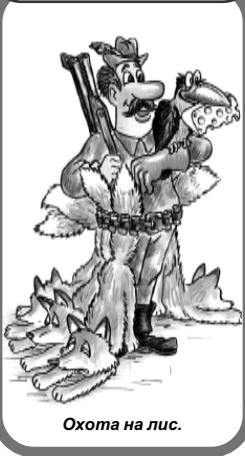
Охота на лис.