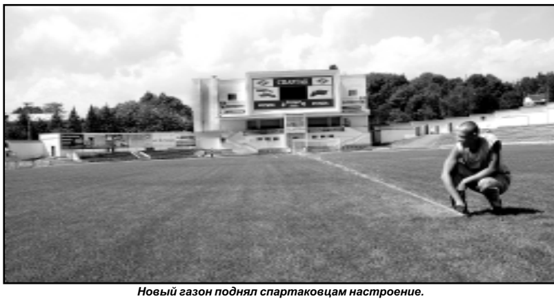
Новый газон поднял спартаковцам настроение.