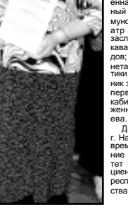
Получать награду всегда приятно.