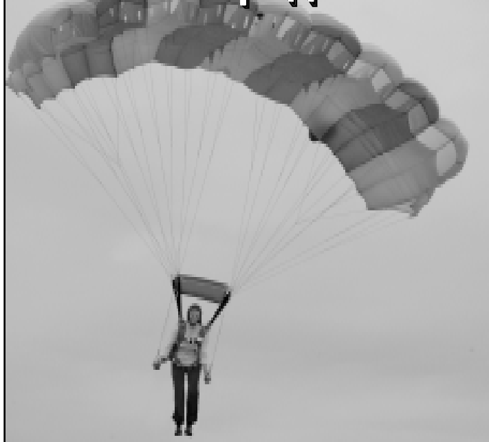
Лестница с неба.

В наши дни количество техногенных катастроф и стихийных бедствий, к сожалению, неуклонно растет. Из разных точек земного шара поступают горестные сообщения то о цунами, то о землетрясениях, то о падении самолетов, но вместе с тем - о беспримерном мужестве поисковиков-спасателей, которые, рискуя жизнью, спасают терпящих бедствие. И мой рассказ именно о таких парнях.