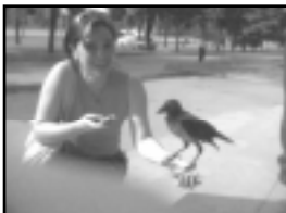
«Щелкнуть» общительную птицу удалось с первого раза.

Черная и угловатая, она выбежала из-за угла и ухватила меня за юбку. Ничего себе! Ворона! — Давай знакомиться! — А она уже карабкается по руке — ей сержки мои понравились, лишь бы ухо не оторвала. Лиорародно набираю номера коллег: «Булатов! Я у входа в Дом печати! Ко мне ворона пристает! Нужен дотокари!». Промокие, спешащие на работу, останавливаются, недоумевают: «Ручная, что ли?». «Не знаю». Черная красавица стучит крепким клювом по трубке, умными глазками-бусинками поглядывая на меня — можно? Нашу идеологию нарушает источник крика какого-то дяденьки: «Тут люди пропадают, а вы со своей вороной!» Каркуша, умища, уже весь хлеб сползала, а нас еще так и не «сфоткали». «Не шевелись!» — наконец мы с пернатой подружкой в объективе. Но тут она выхватывает из сумки ключи и отлетает, но недалеко. «Стоит!». Стоит и, кажется, улыбается: «Красавица, умища, солнышко, рыбка!» — подрадрываешь я по-лисице, ведь «в сердце льстец всегда отыскать люгок». Она не каркула, но клюв от удовольствия раскрыла, клюв выпал — «и была пугловка такова!»