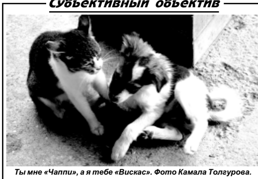
Ты мне «Чапчи», а я тебе «Вискас».

РЫБЫ. Намечается застой в делах, по крайней мере, отсутствие значительного роста в профессиональной и финансовой сфере. А чтобы избежать ненужных конфликтов, а также денежных убытков, достаточно не спешить с принятием важных решений.