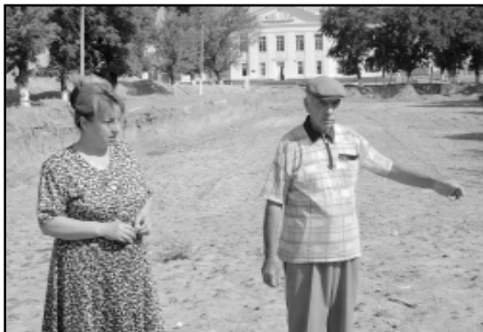
Сейчас на месте школьной аллеи - огромная яма.

няной горы в теплую погоду пыль стоит столбом, а осенью, когда начинаются дожди, здесь образуется непролазное грязево-болото.