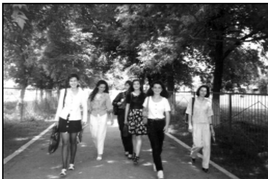
Год назад эта тенистая аллея украшала территорию школы...

Прошлой весной на территории единственной школы планировали построить актов и спортивный залы, но дальше котлована дело не пошло. Через три месяца по непонятным причинам все работы были остановлены. И стоит котлован как опознавательный знак, символ того, что здесь происходит, ключ к пониманию жизни, которую здесь ведут. Он кричит о несбывшихся надеждах и заброшенных начинаниях. И если раньше образ родного села увязывался с цветущим садом и спелыми виноградными гроздьями, то сейчас он ассоциируется с огромным котлованом. Яма заняла место тенистой школьной аллеи и школьного участка, где ребята собирали посаженных своими руками болгарский перец, свеклу и помидоры. И все это в двадцати метрах от порога учебного корпуса, на котором образовалась трещина. Вся вырытая земля перекрывает центральную улицу и огромной горой простирается до расположенного рядом кладбища. Жители проложили там тропинку, на которой двое не смогут разойтись. Чтобы продолжить свой путь, приходится объезжать полсела. От гли-