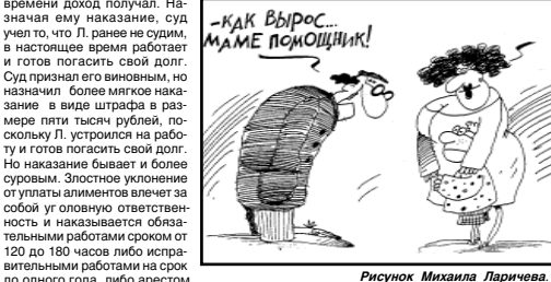
Рисунок Михаила Паричева.