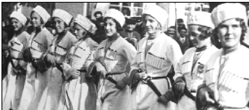
Шествие юных джигиток к 15-летию автономии.