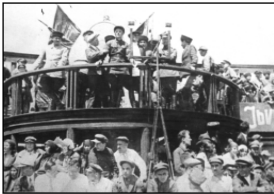
Митинг по случаю вручения Кабардино-Балкарии ордена Ленина.

3. Обязать комитет кинематографии при Совнаркомом СССР выпустить кинофильм «20 лет Кабардино-Балкарии».