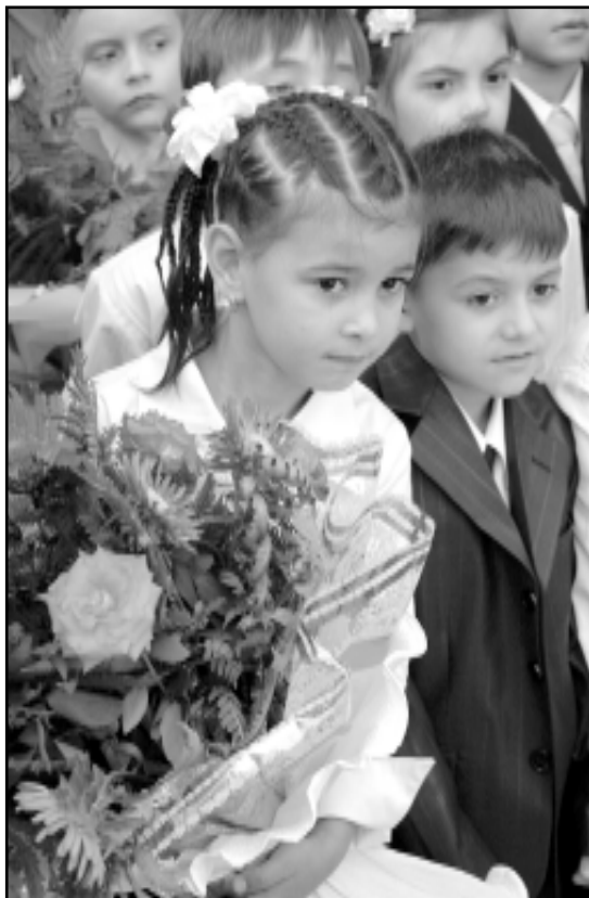
«А где же наша учительница?»