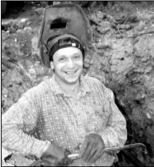
Не кочевары мы, не плотники, мы газ проводим на селе.

Несколько дней назад соседний с нашим дом испытал настоящий шок. В одной из квартир во время ремонта незадачливые строители к газовой трубе подключили водопроводную. Мало того, что в остальных квартирах газовые приборы затрясло так, что жильцы от испуга выскочили на улицу, весь дом «до выяснения обстоятельств и ликвидации последствий» остался без «голубого топлива». Представила себя на месте потерпевших. Ну день на бутербродах продержаться еще можно, но ведь и без душа придется обходиться в сорокаградусную жару. Газ настолько привычно вошел в наш быт, что малейший сбой сразу же нарушает привычный ритм жизни.