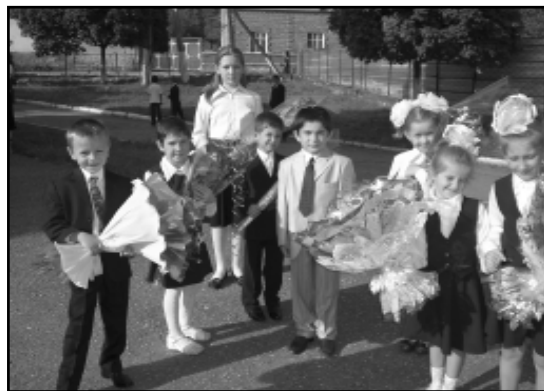
После торжественной линейки.