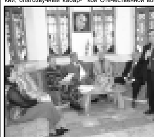
Теплом воспоминаний был пронизан вечер памяти любимого поэта.