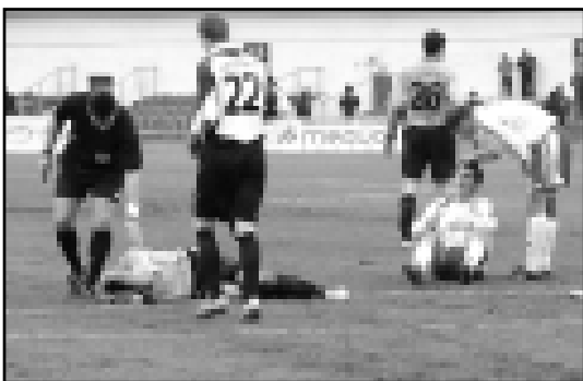
Что больше: 0:0 или травма