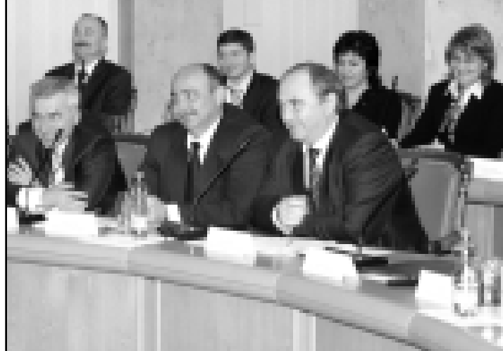
Обсуждение нацпроектов прошло оживленно.