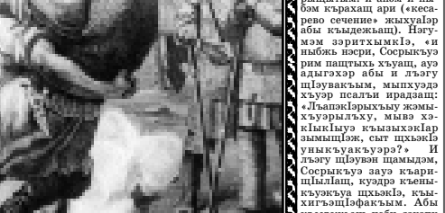
Адыгхэм Ридадэ урысышэ Мстиславэ зобин.