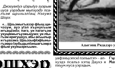
Адыгхэм Ридадэ урысышэ Мстиславэ зобин.