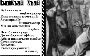
Адыгхэм Ридадэ урысышэ Мстиславэ зобин.