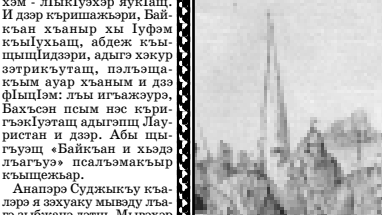
Адыгхэм Ридадэ урысышэ Мстиславэ зобин.