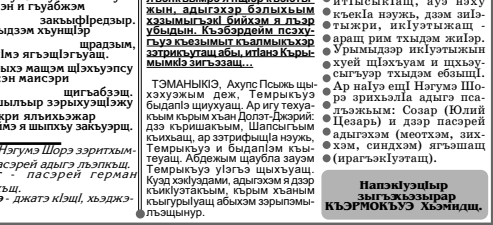
Адыгхэм Ридадэ урысышэ Мстиславэ зобин.