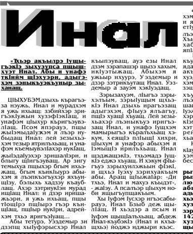
Адыгхэм Ридадэ урысышэ Мстиславэ зобин.

Шыкышэ и шыгуэ, хыбар кылуатэжон шыгуэ. «Шыгуэ ушайтэ» - абы шыкышэ хыдыбары шыгуэ.