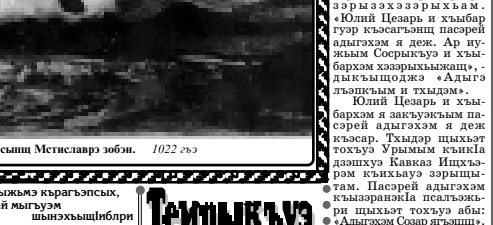
Адыгхэм Ридадэ урысышэ Мстиславэ зобин.