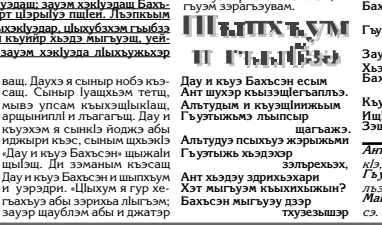
Адыгхэм Ридадэ урысышэ Мстиславэ зобин.