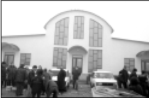
Комментарий главы администрации г. Баксана Юрия АФАСИЖЕВА:

30 января около 80 торговцев Баксанского рынка организовали несанкционированный митинг на мосту при въезде в город Баксан, перекрыв движение. Этим они выразили протест новым требованиям, предъявляемым администрацией рынка. Свой взгляд на сложившуюся ситуацию высказали все участники конфликта: городская администрация, ООО «М-Инвест» Баксанский рынок, а также покупатели и продавцы.