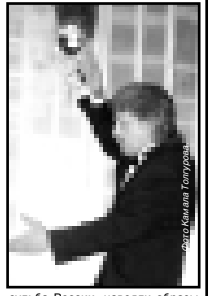
судьба России, навеяли образы седьмой симфонии.