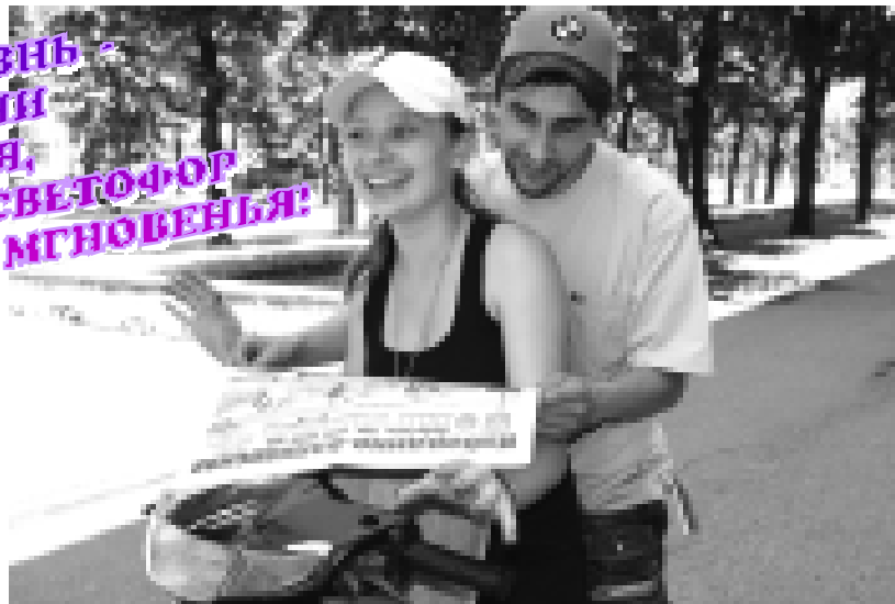
г. Нальчик

ТАКАЯ ЖИЗНЬ - НЕТ ВРЕМЕНИ ДЛЯ ЧТЕНИЯ, НО ДАРЯТ СВЕТОФОР ЧУДЕСНЫЕ МГНОВЕНИЯ!