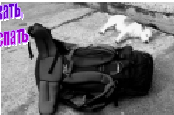
Фото К. Пажитновой, г. Нальчик. «КБП» ПРОВОДИТ КОНКУРС НА ЛУЧШУЮ ФОТОГРАФИЮ. Останови мгновение и пришли свой снимок.

Устала ношу я таскать, решила чуточку послать