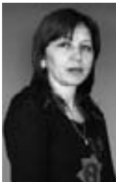
Чегем районну халкъыга билим берген управлениясыны методисти