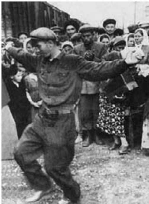
Кавказга – биринчи эшелон! 1957 жыл. Май.