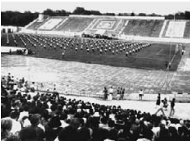
Малкъар-къарачай культураны биринчи фестивали. Ачылгъан кюн. 1991 жыл, Нальчик