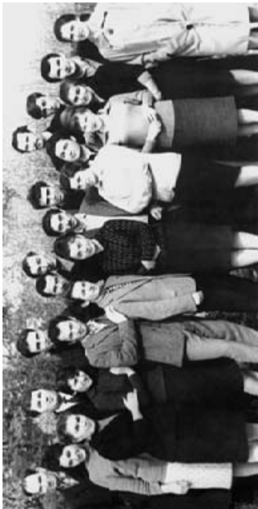
Малкъар драма театрыны артистлери. 18-чи октябрь 1963 жыл.