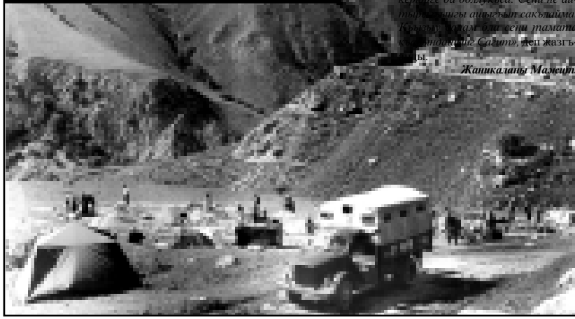
Чегем аузунда Хушто-Сьорт элде школу мурдюру салынады. Сурат 18-чи июлда 1958 жылда алынганды.

Анга шагъатлыкъ этген бир юлюгю келтирейим. Къазахлы жазыучу Къабарты-Малкварда жашагъан шухъларына ийген къагъытында: «Мени столудан «Къазах адабияты» деген литература-суратлау газетни 1989 жылда