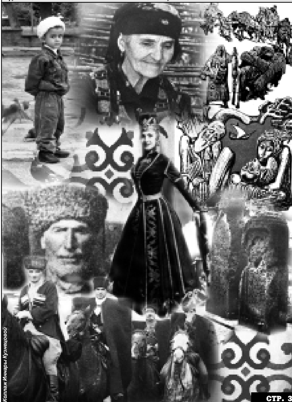
Коллаж Иннары Кузнецовой

аульских улиц, Упасть на прошлогоднюю листву: «ВЕРНУЛИСЬ!»