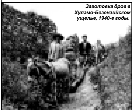
Заготовка дров в Хуламо-Безенгийском ущелье, 1940-е годы.

Архивисты выявили более 100 фотографий и документов, которые передают атмосферу довоенного времени, трагический период депортации, жизнь в Средней Азии, возвращение на историческую родину и последующий созидательный труд балкарского народа на благо КБР. Среди документов экспонируются копии Указов Президиума Верховного Совета СССР от 8 апреля 1944 года о переселении балкарцев, проживающих в КБАССР, и о переименовании республики в КАССР; о снятии ограничений с репрессированных народов, подписанный высшим руководством страны в 1956 году; о переименовании в 1957 году КАССР в КБАССР. Помимо распоряжений из Москвы, на стенде представлены Указы Верховного Совета КБАССР о Законе РСФСР «О реабилитации репрессированных народов» и Президента КБР В. М. Кокова (1994 г.) об установлении 28 марта Дня возрождения балкарского народа. Наверняка не оставит никого равнодушным еще один документ – расписка спецпереселенца, в которой репрессированный ставил свою подпись над текстом, где говорилось о том, что человек выселен навеки и что за самовольный выезд или побег его ждет 20 лет каторжных работ.